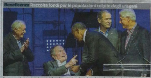
Cinque ex presidenti americani al concerto in Texas. Da sinistra, Jimmy Carter, George Bush sr, Barack Obama, George Bush jr e Bill Clinton