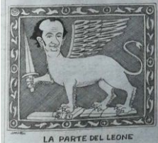
LA PARTE DEL LEONE